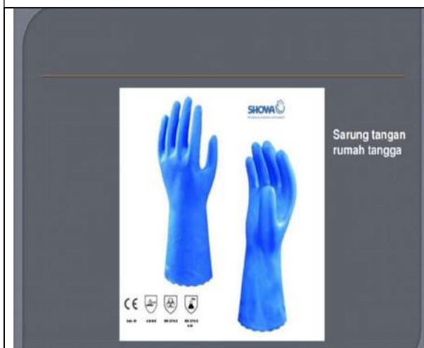
Gambar 3. Contoh Handscoon