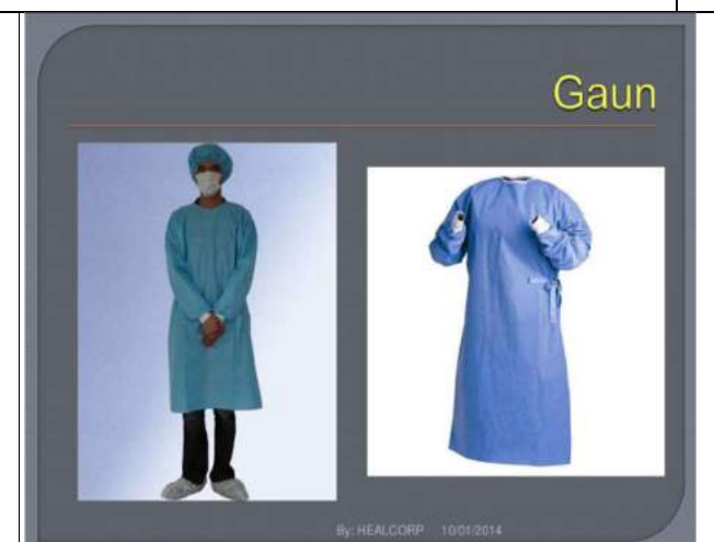
Gambar 4. Contoh Gaun/Jas laboratorium