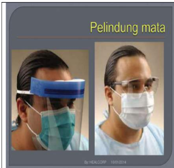
Gambar 1. Contoh Face Shield /Kacamata Google