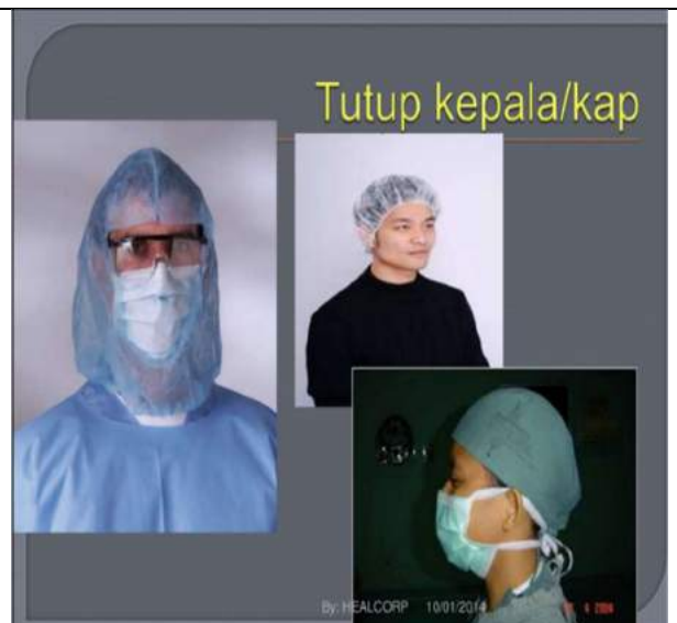
Gambar 2. Contoh Penutup Kepala