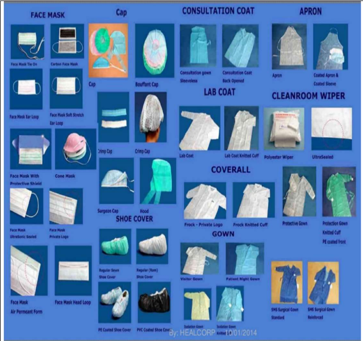
Gambar 5. Contoh Macam-macam APD

Jalan Kapas 9, Semaki Yogyakarta 55166 | Hotline : 0822 4161 6553 email : satgascov@uad.ac.id